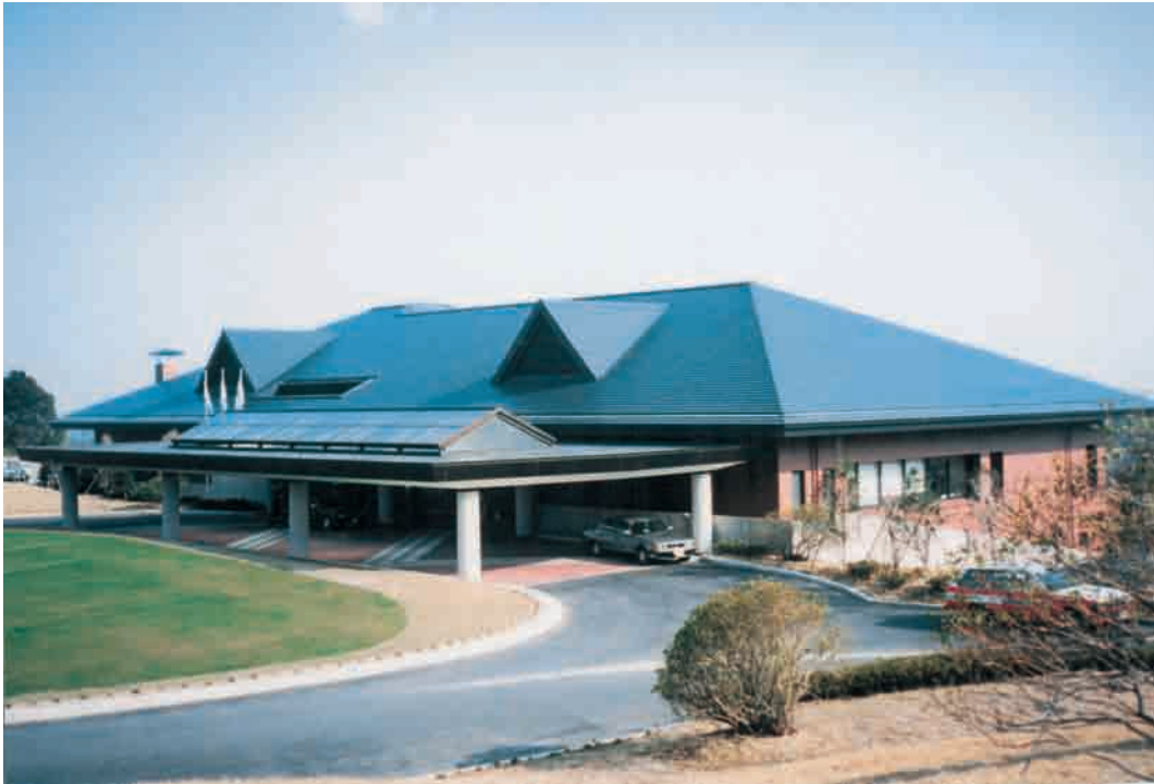
ゴルフ場クラブハウス