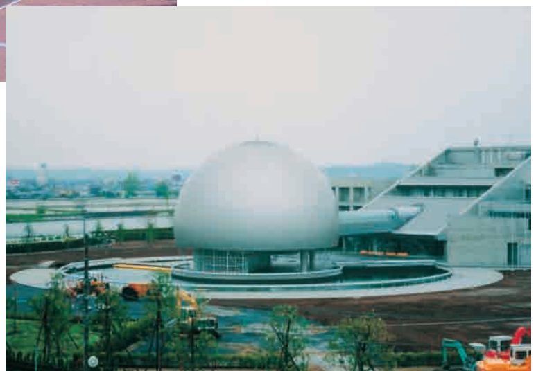
小見川プラネタリウム