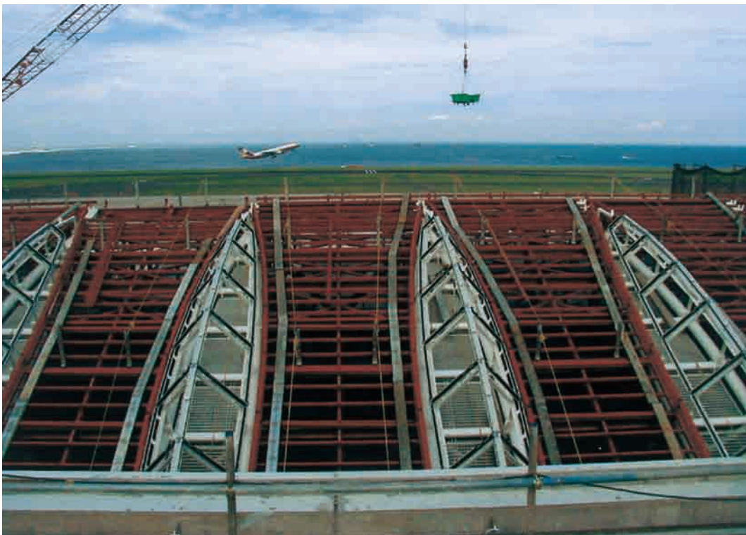
東京国際空港（羽田）